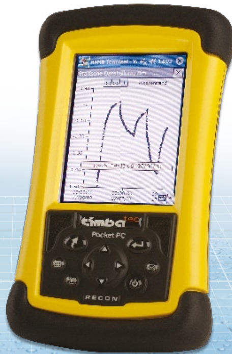
• Pocket-PC RECON

Fácil manejo de datos para la programación y lectura de unidades de transmisión de datos HT